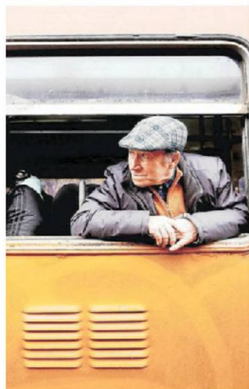
►► Una persona en un carro en el tren que va desde Talcahuano hasta la comuna de Laja.

Pero las diferencias entre países ricos y pobres persisten. Así como hay 29 naciones que pasan de los 80 años, otras 22 apenas superan los 50. Estas mismas diferencias se dan al interior de los países entre ricos y pobres, dice Lavadero. ●